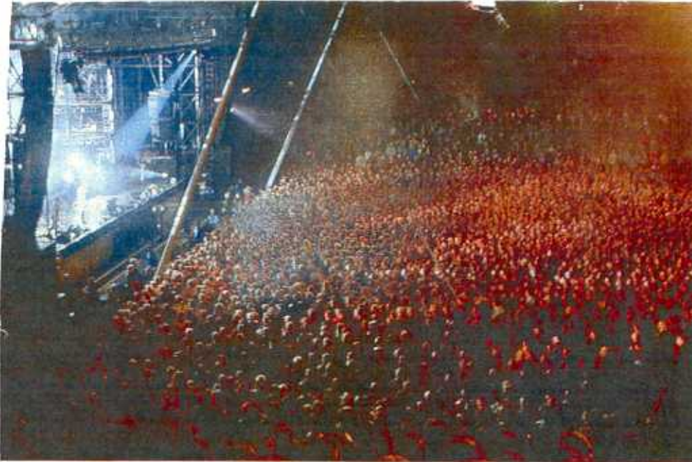
Bei Konzerten, wie hier in Berlin-Wuhlheide, lockt Rammstein Zehntausende

ber in Hamburg. Und was die Rechten angeht: Für mich geht der Staat zu weichwurstig mit dem Problem um. Du haust einen Schwarzen halbtot, und zur Strafe gibt es Aufbaustunden. Wir haben uns schon vor der Wende in Schwerin immer mit den Skins geprügelt – warum greift man heute nicht härter durch? Ich bin mit einem Mädchen aufgewachsen, die ist Mulattin. Die kommt immer noch jeden